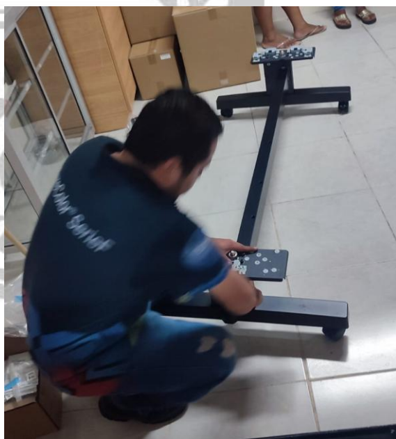
Base de la impresora