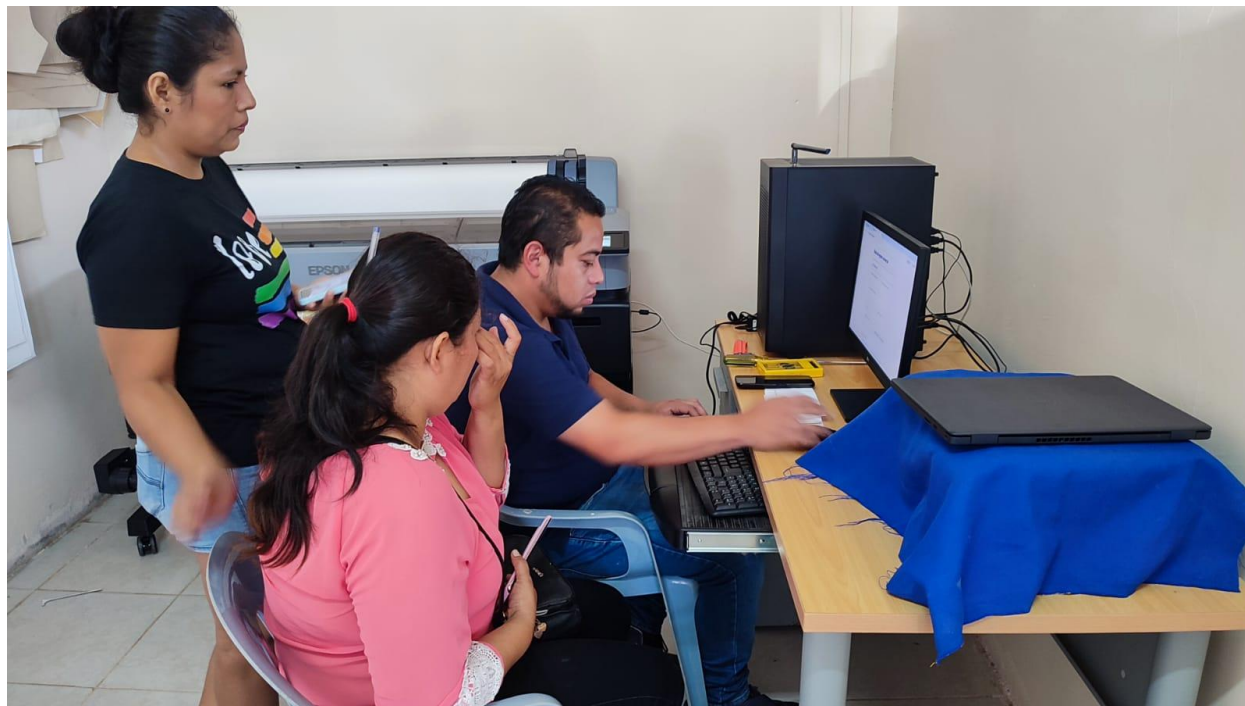
Taller de Capacitación manejo de impresora de sublimación de tinta.