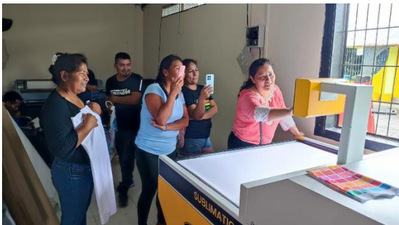
Taller de Capacitación manejo de la sublimadora.