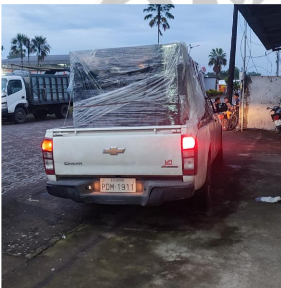
Impresora de sublimación de tinta