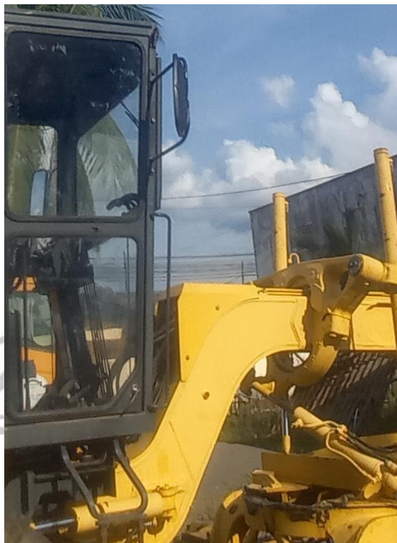
Plumas limpia parabrisas