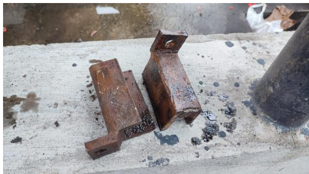
Uñas del Ripper