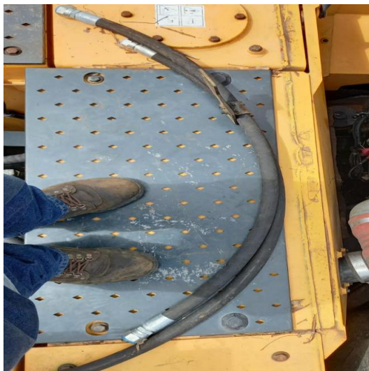
Enfriador de aceite hidráulico