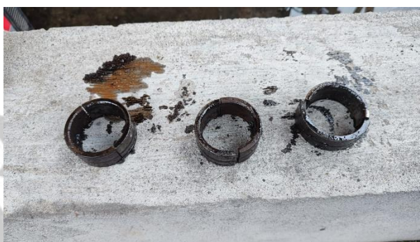
Pernos de sujeción del reductor de giro de la cuchilla