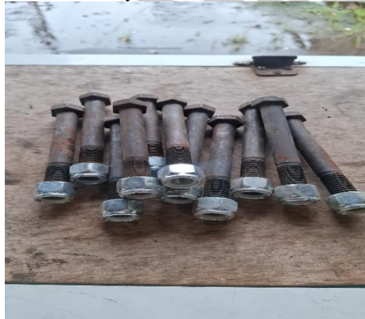
Corredizos de la cuchilla