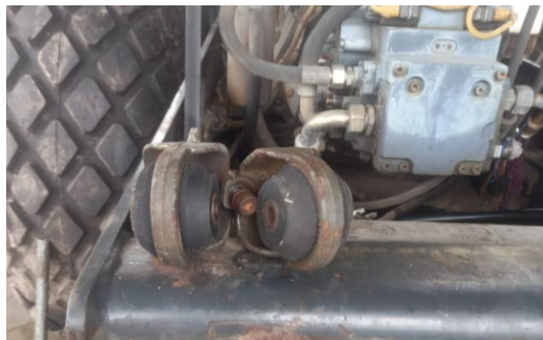
Chapa y el seguro del Capot