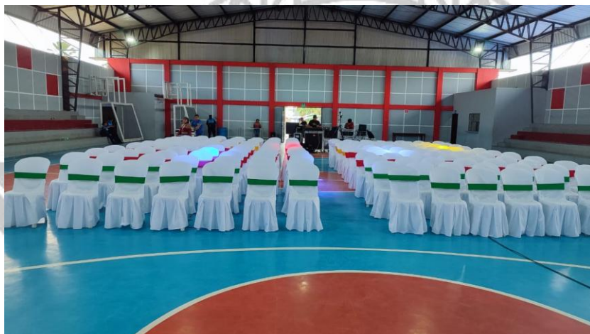
Telas tipo velo en escenario y fondo