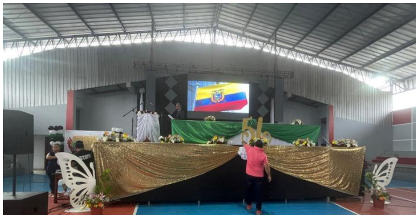
Animador para evento cívico cultural sesión solemne