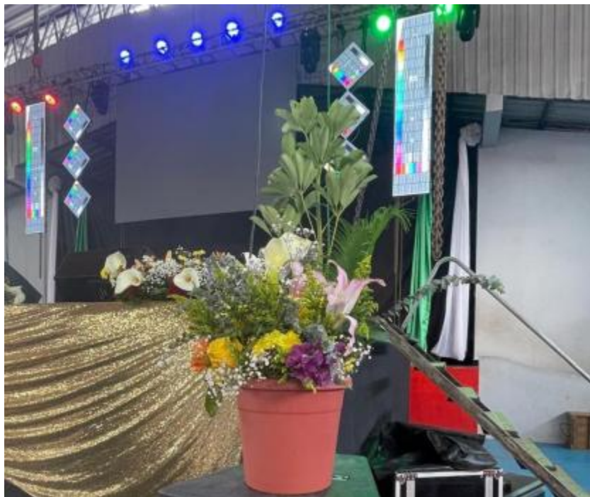
Fondo con tela tensada