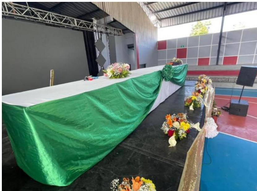
Elementos de ambientación