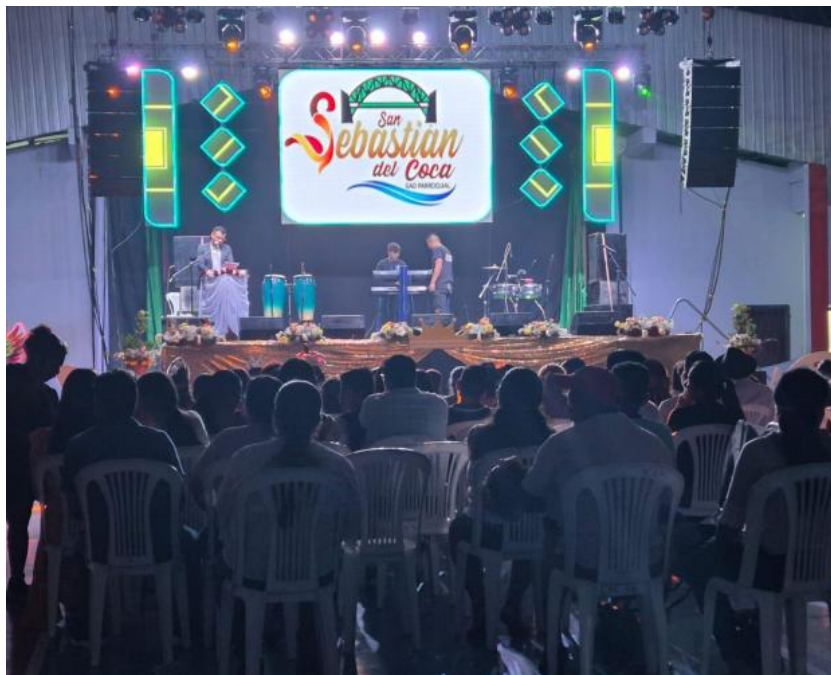
Artista local Grupo Yaku Ruma