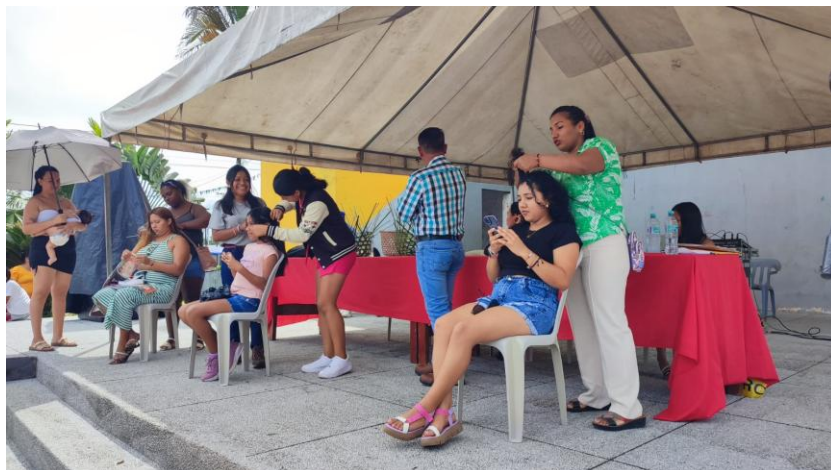
Evento de arte y danza "San Sebastián del Coca intercultural" Decoraciones